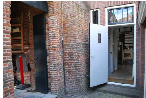
Een teleurstellend vervolg