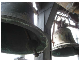
Van den Ghein me fecit 16 e eeuw

De mogelijkheid om veel nieuwe bezoekers te trekken zal in belangrijke mate voortkomen uit de ontsluiting van de speeltoren. Dat is ook de reden waarom de nieuwe huisvesting van het museum op de oude locatie blijft en er naast de speeltoren een historiserende versie van de oude Vingboonsgevel komt. Alleen zo kan er ter hoogte van de verdieping waar de speeltrommel zich bevindt een oude doorgang in de toren opnieuw geopend worden naar het museum toe. Weliswaar is de toren fysiek slecht te betreden, maar via de doorgang en 'balkon' goed zichtbaar. Het klokkengedeelte kan niet bezoekbaar worden gemaakt, maar met een bestuurbare camera of webcam wordt een leuk interactief element aan het verhaal toegevoegd.