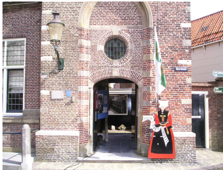
Een veelbelovende entree

Het huidige bezoekersaantal schommelt tussen de 1500 - 2500. Veel Waterlanders kennen het museum niet eens of hebben het ooit één keer bezocht. Schoolgroepen maken beperkt gebruik van het museum, de ruimtes zijn er weinig geschikt voor. Het huidige museum appelleert nauwelijks aan de interesses en de beleving van de jongere doelgroepen. Een groot deel van de bezoekers bestaat uit toeristen uit binnen- en buitenland, waarvan het grootste gedeelte op de binnenplaats helaas omdraait wanneer men verneemt dat de speeltoren als toren niet te bezichtigen valt. Voor liefhebbers van hedendaagse kunst heeft het museum (op kleinschalige incidentele expositie na) nauwelijks iets te bieden.