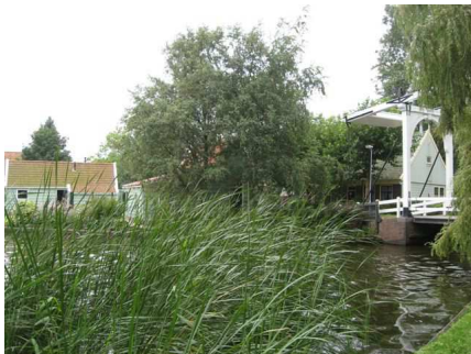
Zicht op Zuiderwoude

Veel van de inwoners van Waterland weten nauwelijks hoe dit bijzondere gebied is ontstaan. Voor de toeristen is dit een van de meest klassieke stukjes Nederland: polders, kreken, meren en dijken met oude kleine nederzettingen en de voormalige Zuiderzee die buiten de dijk ligt. Het landschap van Waterland spreekt nationaal en internationaal gezien tot de verbeelding tot aan de mythevorming over Hansje Brinker toe.