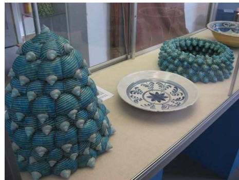
Steengoed in Kunst, augustus 2008