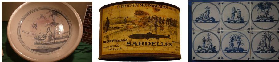
Enkele voorwerpen uit de collectie

Onder cultureel erfgoed verstaan we getuigenissen van materiële cultuur, het geschreven woord, beeldmateriaal en geluidsopnamen. Het museum verzamelt ook getuigenissen van het hedendaagse leven in Waterland welke waardevol zijn voor toekomstige geschiedschrijving en presentaties in het museum.