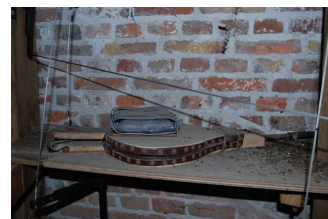
De blaasbalg waardoor de de bazuin van de Faam klinkt

De unieke speeltrommel die in de nieuwbouw toegankelijk wordt gemaakt