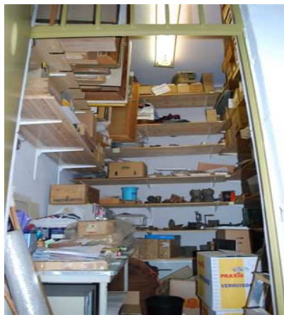
De oude politiecel als depot

Het huidige Museum de Speeltoren is, ondanks alle grote inspanningen van de vele vrijwilligers door de jaren heen, door zijn zeer beperkte vierkante meters en zijn ontoegankelijke speeltoren nauwelijks in staat een groeiend publiek te trekken. Dat is jammer. Vooral omdat de collectie en eventueel die van de participerende oudheidkundige verenigingen wel degelijk de potentie hebben om een hoger bezoekersaantal te genereren. Echter door de te kleine ruimte en de klimatologisch ontoereikende voorziening is het collectiebeheer ernstig beperkt en daarmee kwalitatief onder de gangbare museumnorm. Dat betekent dat diverse verzamelaars weliswaar de intentie tot schenking hebben uitgesproken, maar door bovengenoemde omstandigheden dat nu nog niet willen doen. Ook de inzet van bruiklenen van collega musea is nu niet verantwoord.