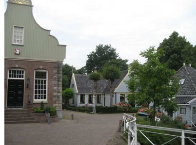
Broek in Waterland