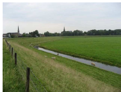
Zicht op IJpendam