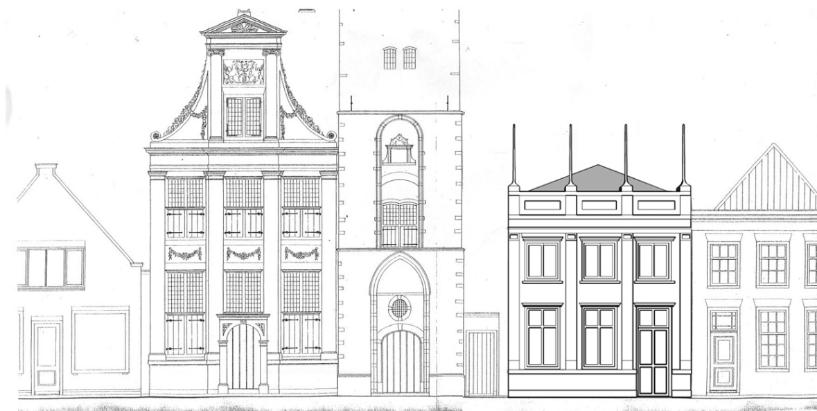
Reconstructie 17 e eeuwse gevel oude stadhuis